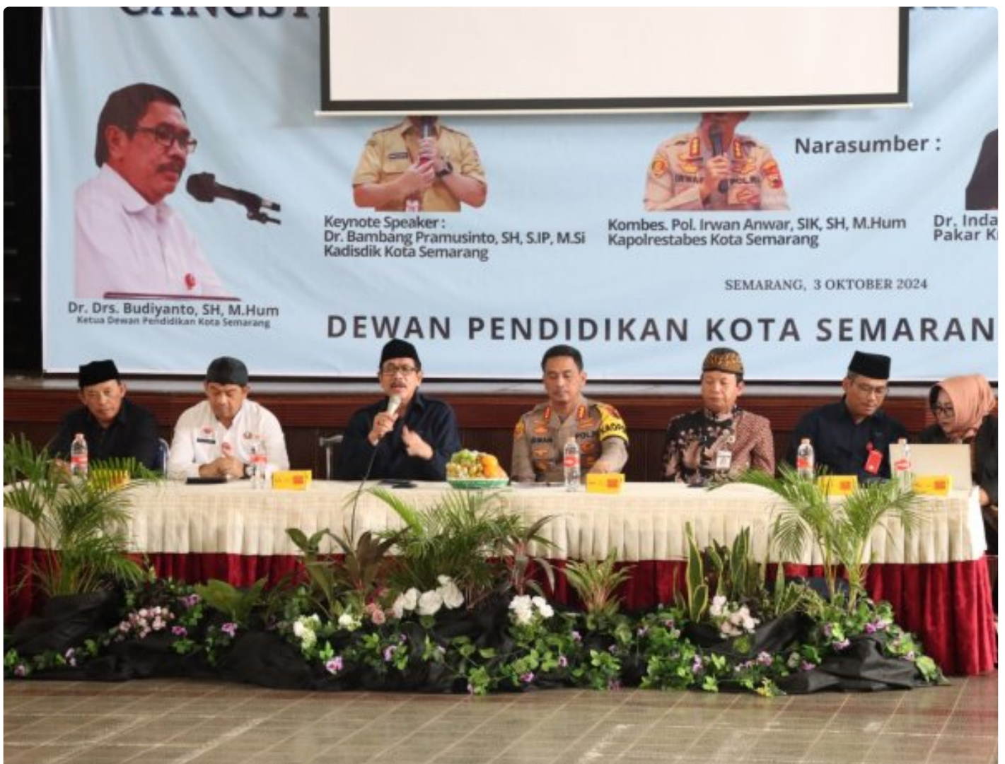
Foto: Dewan Pendidikan Kota Semarang Mengadakan Sesi Dialog bertajuk "Gangster Meresahkan Masyarakat" di Aula SMA 1 Negeri Kota Semarang Jawa Tengah, Kamis (3/10/2024).

KOTA SEMARANG- Dalam rangka menanggulangi maraknya isu kenakalan